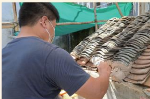
學員們回到荔枝窩嘗試搭建一個仿屋頂的小型模型，希望學員在過程中體驗，一個平平無奇瓦頂，背後需要花費時及功夫。