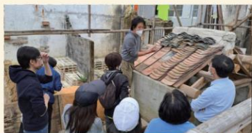
古建拉藝 立化傳承—荔枝窩： 鋪瓦工作坊