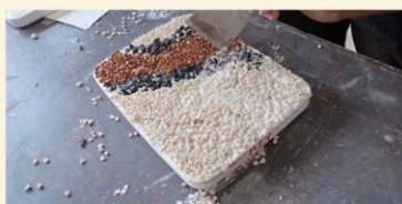
古建拉藝 立化傳承—荔枝窩： 洗水石米工作坊