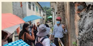
古建拉藝 立化傳承—荔枝窩： 荔枝窩歷史建築導賞團